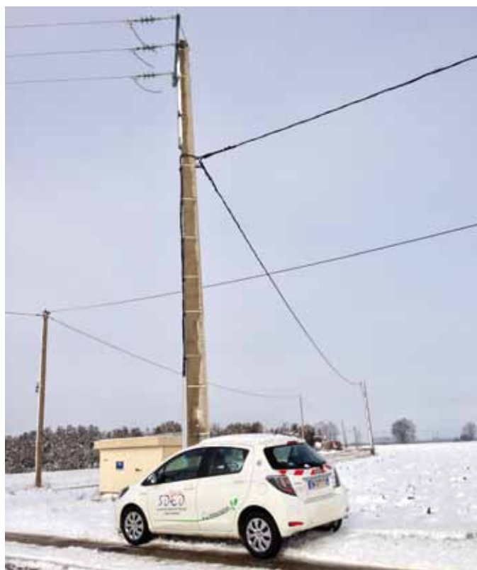
Depuis 2012 Energie SDED roule 100% Hybride

Une autre façon de promouvoir les véhicules non polluants auprès du grand public : Énergie SDED participe au Challenge des collectivités dans le cadre du Rallye Monté-Carlo des énergies nouvelles