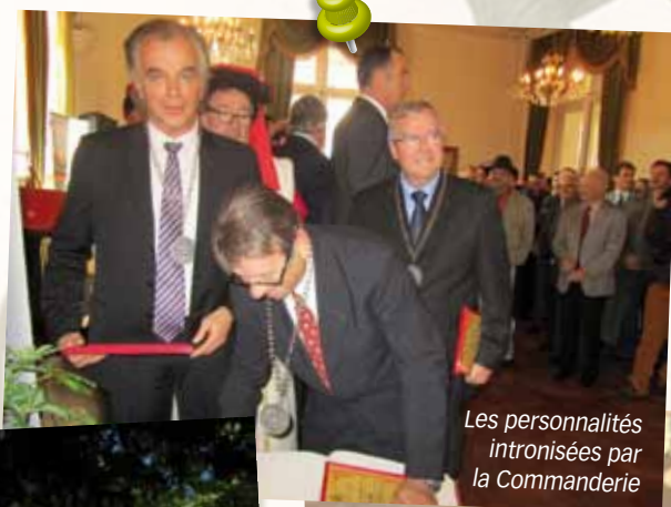
Les personnalités intronisées par la Commanderie