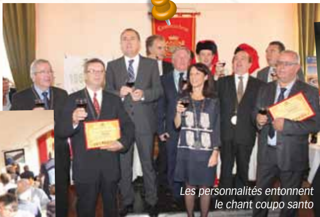
Les personnalités entonnent le chant coupo santo

2009 : L'arrivée de la dernière commune de la Drôme, Valence, à Energie SDED a été déterminante. Ainsi nous représentons toutes les communes. L'union fait la force. Depuis la solidarité s'exerce en totalité car cette adhésion se traduit par de nouveaux moyens financiers.