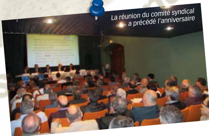
La réunion du comité syndical a précédé l'anniversaire