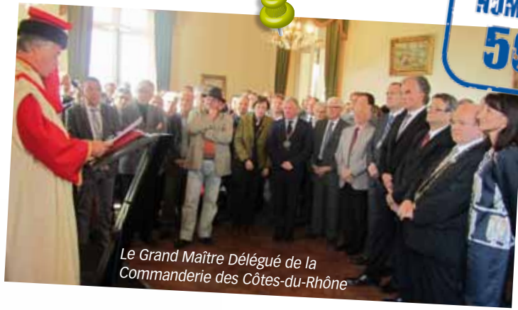
Le Grand Maître Délégué de la Commanderie des Côtes-du-Rhône

De notre histoire plus récente, retenons simplement 3 dates :