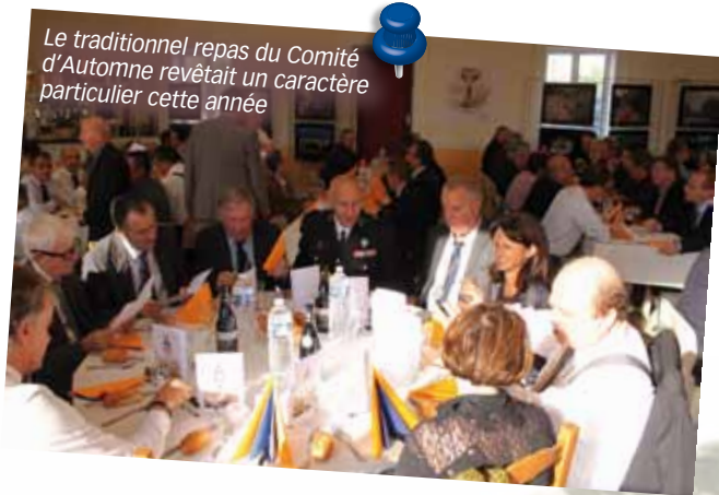
Le traditionnel repas du Comité d'Automne revêtait un caractère particulier cette année