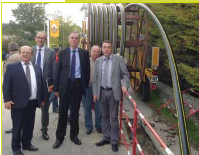
Premières poses de canalisations