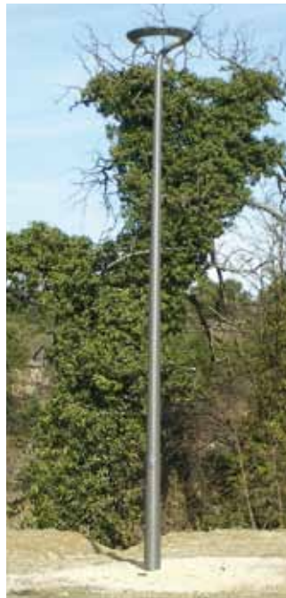
Candélabre « paysager » la beauté du mobilier l'efficacité du LED en plus